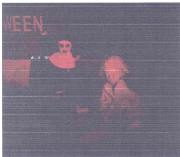
Reprodução de fantasia artística de “A Freira” de “Invocação do Mal”