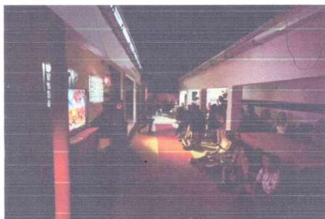
Oficina cultural: Contexto histórico-social do Halloween