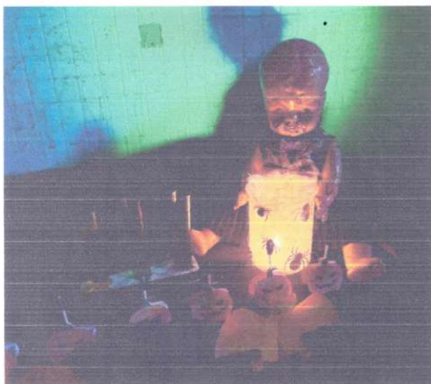
Reprodução de ambientações artísticas interdisciplinares (Química, Artes e Inglês) inspiradas no Halloween