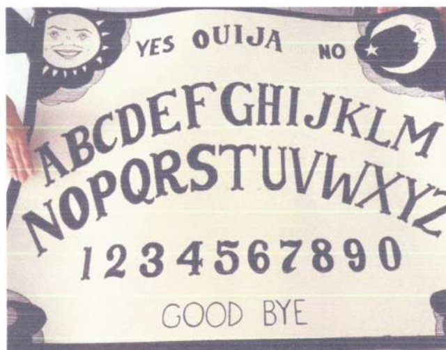
Reprodução de instalações artísticas inspiradas no Halloween - Tabuleiro Ouija